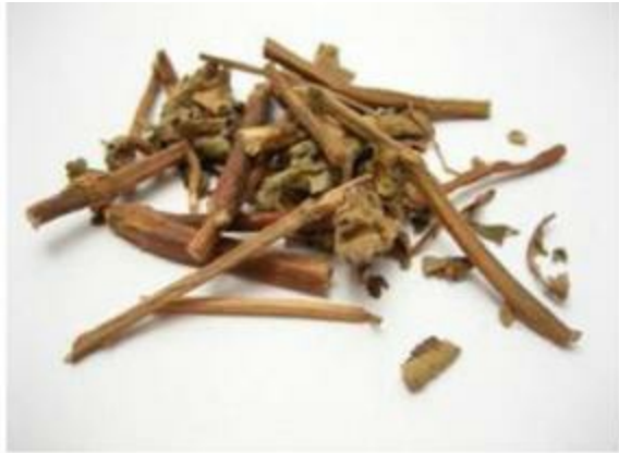
b) 甘草 (Gan Cao, English term: Liquorice)